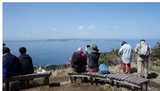
鋸山展望台からの東京湾。対岸は横須賀、左側奥に富士山がうっすら見えます。(き)

3月に妻と二人で南房総に行ってきました。旅行割を使ってお得な旅でした。初日は終日雨で、宿泊先の館山への移動のみ。2日目は快晴で、房総フラワーラインを中心に、車に積んでいった自転車でサイクリング。約40kmをあちこち巡りながらのんびりと走りました。ちなみに館山カントリークラブの周辺を走りましたが、すごく開放感のあるゴルフ場でした。3日目は車で鋸南町に移動し、東京湾フェリーの発着地である金谷港近辺に駐車して、千葉の名峰、鋸山(のこぎりやま)を歩いてきました。低山ですが、石切り場跡のインダストリアル感と、東京湾越しに見る富士山の絶景ポイントとして有名です。この日も天気にも恵まれ、8km弱の山道を3時間半程度かけて歩きました。妻との旅行はいつもこんな感じで、運動部の合宿のようになってしまいます。体が動くうちはこれでよいかなと思っています。