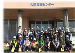
R1.11.2(土)~3(日)開催 ある町の長い遠足の様子