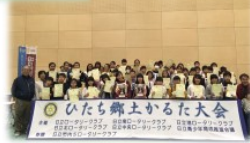
R2.1.11 開催 第15 回ひたち郷土かるた大会の様子